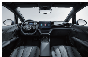
Nero e grigio