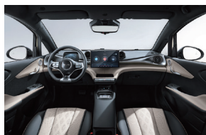
Nero e marrone